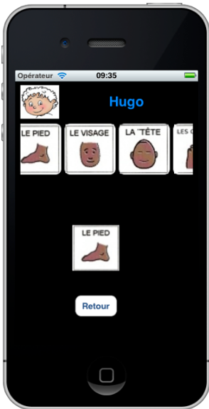
Fig.4 Message avec une image