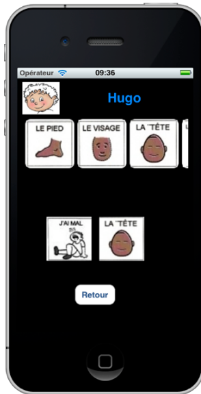
Fig.5 Message avec deux images