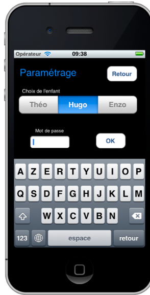
Fig.2 Paramétrage Utilisateur