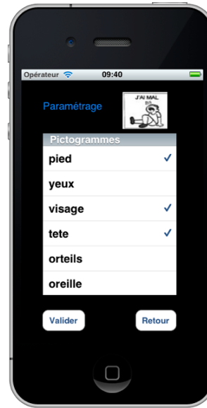
Fig.3 Paramétrage Lexique