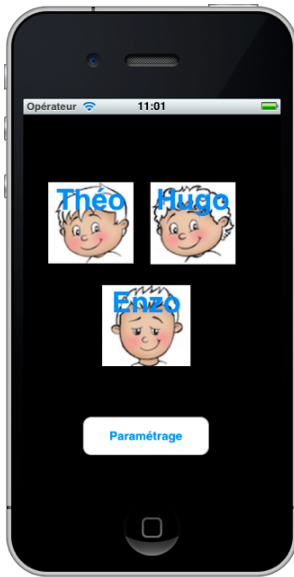
Fig.1 Paramétrage Utilisateur